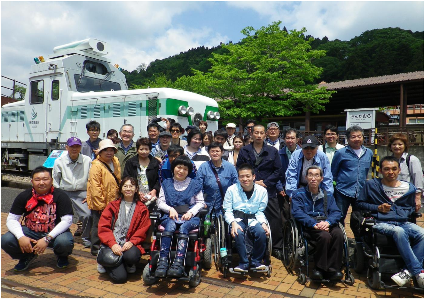
れっしゃじょうしゃ こ ぜんいんしゅうこう ☆トロッコ列車乗車後に全員集合 ☆